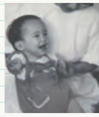
※写真は、ご本人が幼少時のものです。

ことはないと思っています。力強く生きることで苦難を乗り越えるしかないのです。このサリドマイドが、現在、再び認可され使われています。多発性骨髄腫という血液のがんやハンセン病の症状に効果があることが分かったためです。薬そのものが悪いのではない—二度と同じような被害を起こさないために、この薬の危険性をよく知って、慎重に使用してほしいと思います。